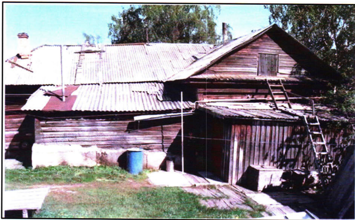
Фото 4. Общий вид западного фасада с сеними объекта культурного наследия регионального значения «Жилой дом (кон.18. - нач.19 вв.)»