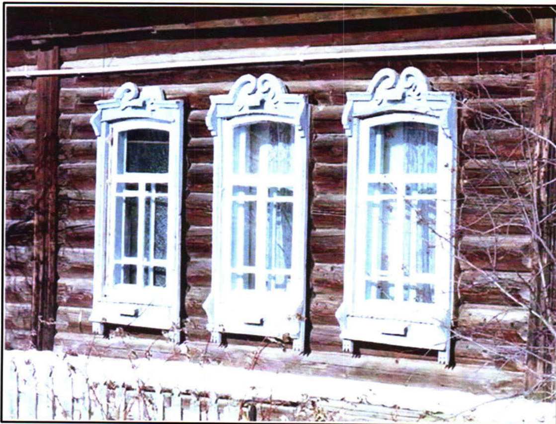
Фото 3. Резные наличники окон, резной штакетник южного фасада объекта культурного наследия регионального значения «Жилой дом (кон.18. - нач.19 вв.)»