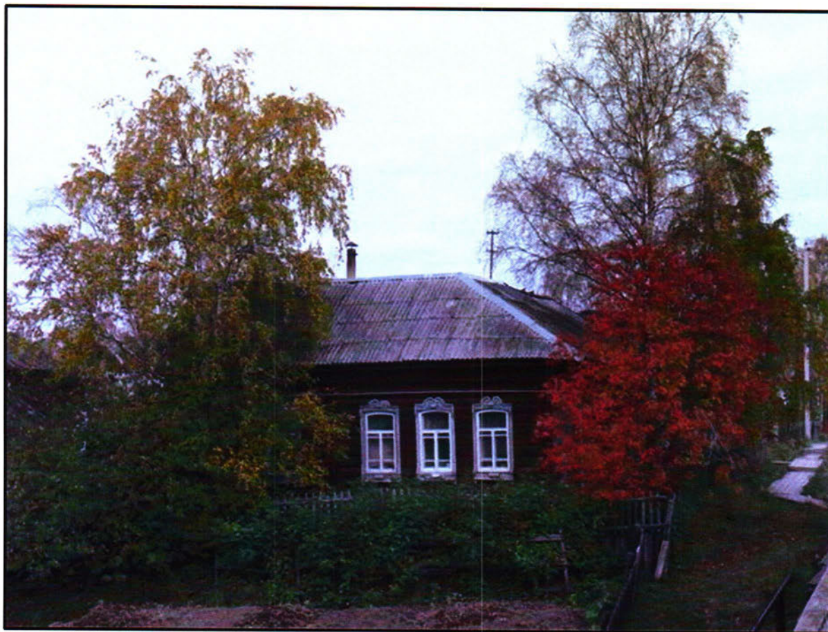
Фото 6. Южный фасад объекта культурного наследия регионального значения «Жилой дом (кон.18. - нач.19 вв.)»