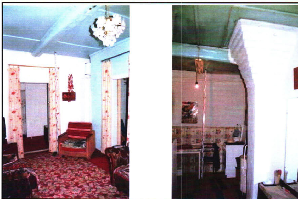
Фото 1. Особенности кладки печи и устройства потолка объекта культурного наследия регионального значения «Жилой дом (кон.18. - нач.19 вв.)»