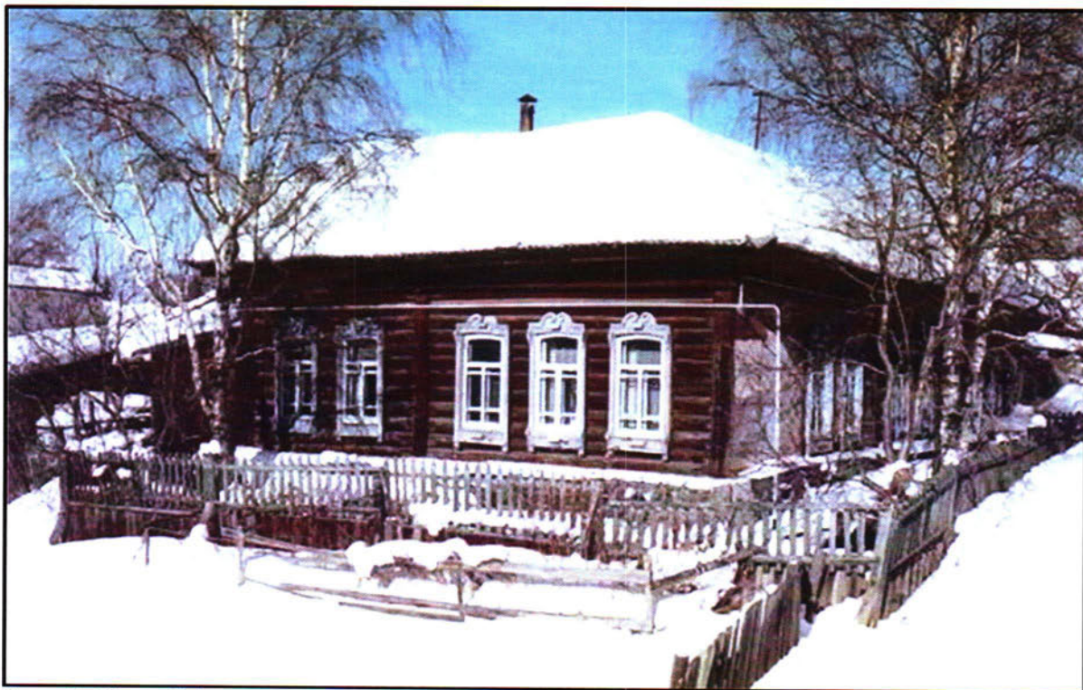
Фото 5. Южный фасад и часть восточного фасада объекта культурного наследия регионального значения «Жилой дом (кон.18. - нач.19 вв.)»