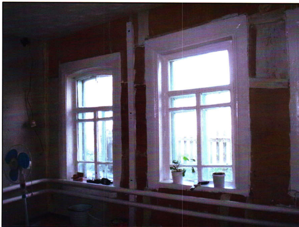
Фото 2. Окна объекта культурного наследия регионального значения «Жилой дом (кон.18. - нач.19 вв.)» с внутренней восточной стороны. Первое окно слева сохранилось с 19.в., второе окно заменено после ремонта.