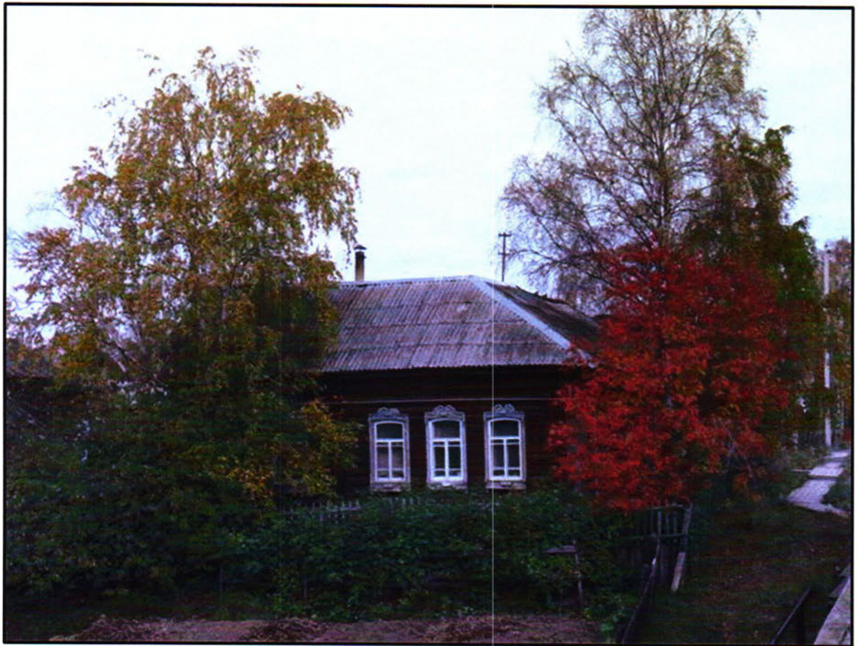
Фото 6. Южный фасад объекта культурного наследия регионального значения «Жилой дом (кон.18. - нач.19 вв.)»