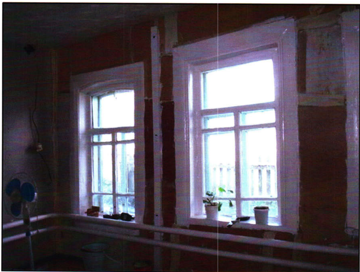
Фото 2. Окна объекта культурного наследия регионального значения «Жилой дом (кон.18. - нач.19 вв.)» с внутренней восточной стороны. Первое окно слева сохранилось с 19.в., второе окно заменено после ремонта.