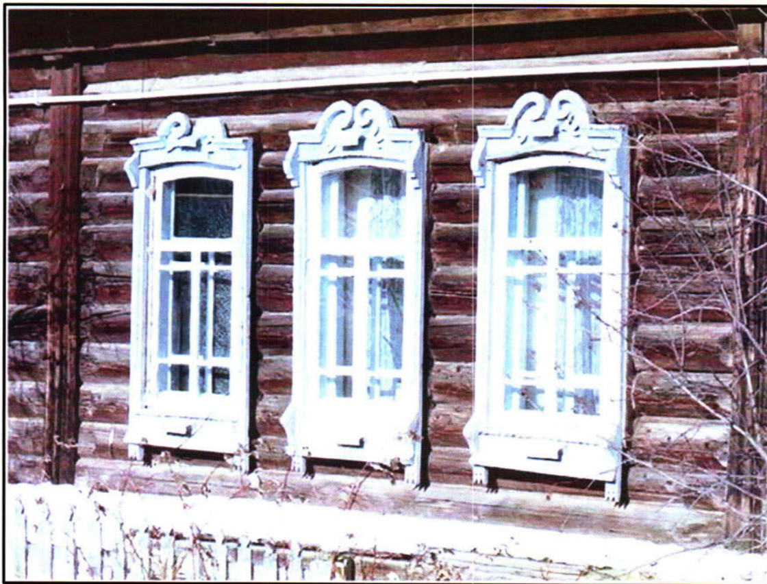
Фото 3. Резные наличники окон, резной штакетник южного фасада объекта культурного наследия регионального значения «Жилой дом (кон.18. - нач.19 вв.)»