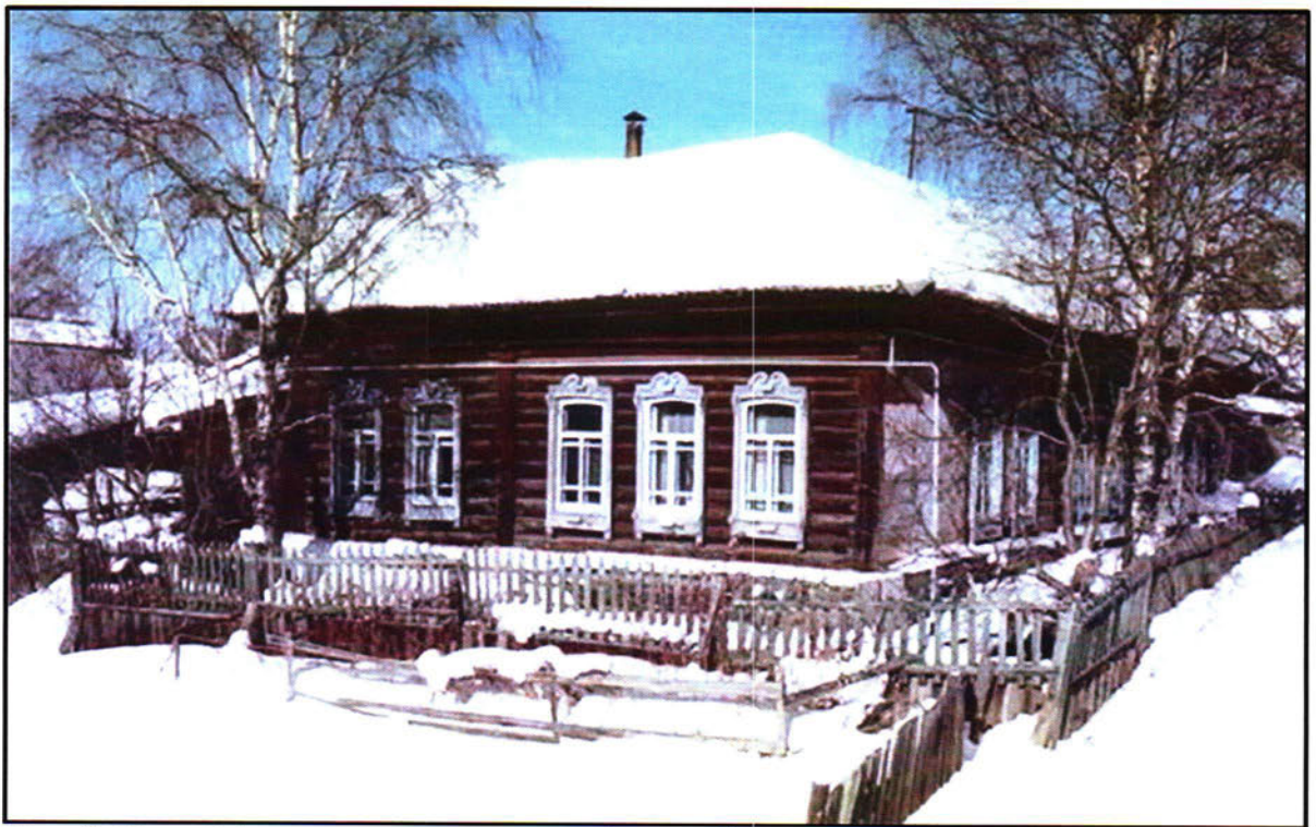
Фото 5. Южный фасад и часть восточного фасада объекта культурного наследия регионального значения «Жилой дом (кон.18. - нач.19 вв.)»