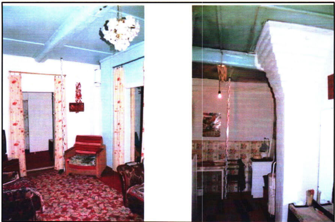
Фото 1. Особенности кладки печи и устройства потолка объекта культурного наследия регионального значения «Жилой дом (кон.18. - нач.19 вв.)»